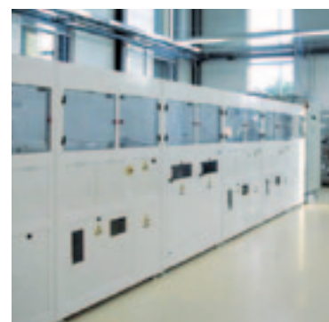
Banco de trabajo para ensayos por vía húmeda de SIMONA® PVC-C CORZAN FM 4910 G2