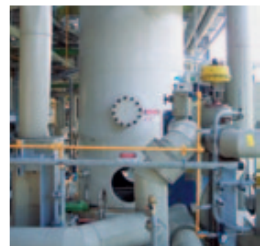
Recipientes redondos de SIMONA® PVC-C CORZAN Industrial Grade