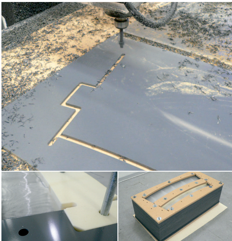
Oben: Ausfräsen der einzelnen Schalungselemente aus SIMONA® PVC-CAW. Unten links: Aufbau der Schalung mit Polyurethan-Trennstreifen und Lichtleitfaser- matten. Unten rechts: Das fertige Schalungssystem.

Im Rahmen eines Forschungs- und Entwicklungsprojektes des Fachbereichs Architektur, Stadtplanung, Landschaftsplanung der Universität Kassel wurde 2010 ein innovatives Schalungssystem für die Herstellung von Lichtleitfaserbeton mit integrierter Kerndämmung entwickelt. Durch das Einlegen optischer Lichtleitfasern werden Licht, Farben und Bewegung silhouettenhaft durch Beton transportiert.