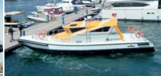
Von links nach rechts: Aufbauten in der Werkhalle; ablassen des Bootes; einsatzfähiges Boot zu Wasser